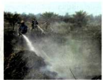
Anggota bomba sedang giat melakukan kerja-kerja pemadaman kebakaran di Hutan Simpanan Kuala Langat Selatan di Tanjung Sepat.

terpadam di permukaan, namun kebakaran masih berlaku di dalam tanah yang mencecah kedalaman semeter," katanya pada Selasa.