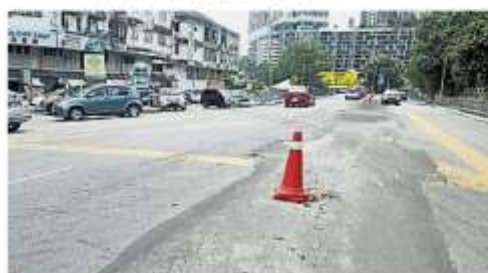
班登柏蘭嶼烏達瑪路交通繁忙，路面不平，公路使用者受促小心上路。