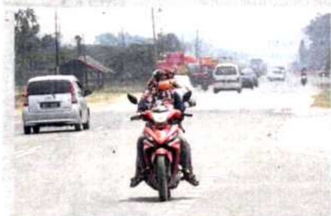
JEREBU di sekitar Kampung Johan Setia, Klang dengan bacaan indeks Pencemaran Udara (IPU) adalah 189 iaitu paras tidak sihat, semalam.

Bagaimanapun, MetMalaysia tidak menjangkakan keadaan cuaca panas luar biasa akan berlaku pada tahun ini.