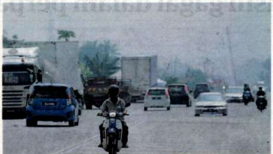
KEADAAN jerebu di sekitar Kampung Johan Setia, Klang, Selangor dengan bacaan Indeks Pencemaran Udara (IPU) mencapai paras 189 iaitu tidak sihat.