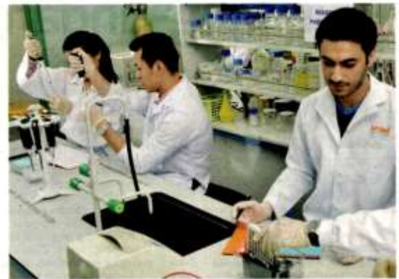
UNISEL menyediakan program akademik sains kesihatan yang terampil, pelbagai disiplin dan fleksibel untuk mereka yang berminat dalam bidang berkenaan.

Seielah penuntut dibekalkan dengan ilmu teori dan kemahiran praktikal yang dipelajari di universiti,