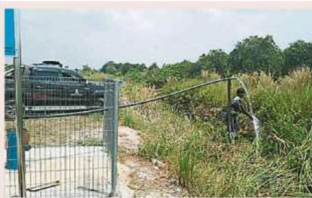
巴生县署和水利灌溉局展开了系列措施，确保佐汉士迪亚水源充足灭火。