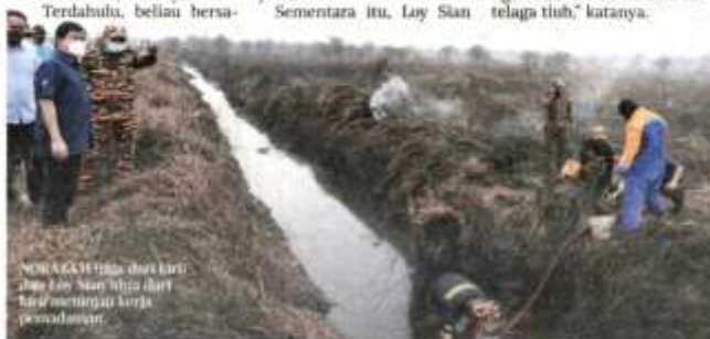
NORAZAM (tengah) dan Hee Loy Sian (kanan) hari ini menyertai kerja pemadaman.

"Kita mengaktifkan tujuh telaga tiuh berdekatan kawasan kebakaran bagi tujuan total flooding dan direct attack serta membuat pemadaman menggunakan kaedah direct attack dan membuat saluran air ke dalam kawasan kebakaran dengan sumber air dibekalkan telaga tiuh," katanya.