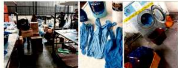
The factory near Bangi is rewashing and repackaging used gloves for sale. (Clockwise from top left) Workers in the factory, blue gloves hanging, and a washing machine in the factory.