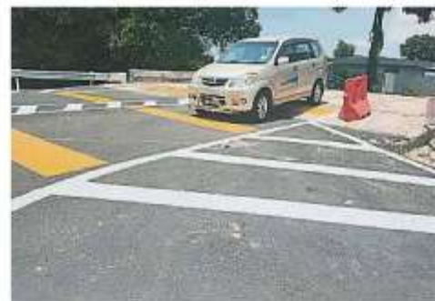
车辆从小桥驶下时必须缓速，以免速度太快损伤汽车底盘。