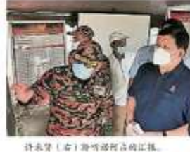
许来贤（右）聆听消防员的汇报。

掌管消防、环境、绿色科技及原住民事务的行政议员许来贤今日亲自到瓜冷南區森林保留地林火，了解灭火工作进展。