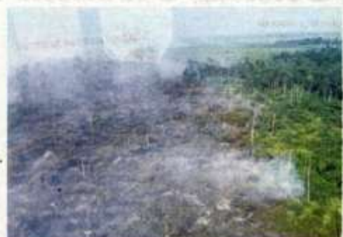
KESAN kebakaran di Hutan Simpan Kekal Kuala Langat Selatan. – BESAN JBPM SELANGOR

Katanya, seramai 130 anggota dari Jabatan Bomba dan Penyelamat (JBPM Selangor, Unit Pengurusan Bencana Selangor, Majlis Perbandaran Kuala Langat, Jabatan Mineral dan Geosains Selangor, JPNS dan Maritim Malaysia. Sementara itu, empat ka-