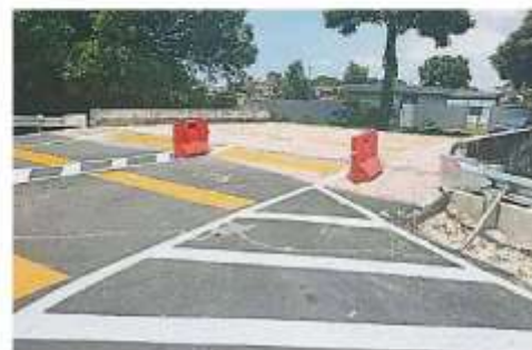
负责提升小桥的承包商没做好衔接工作，导致小桥接口出现严重的坡度差距，危及驾驶者安全。