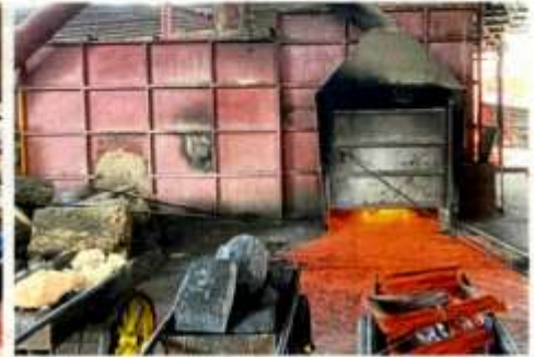
The recycling factory (left) and metal smelting premises that were found to have violated notices of closure issued by the Hulu Selangor District Council.

HULU Selangor District Council (MDHS) has clamped down on two premises for illegal activities during an operation.