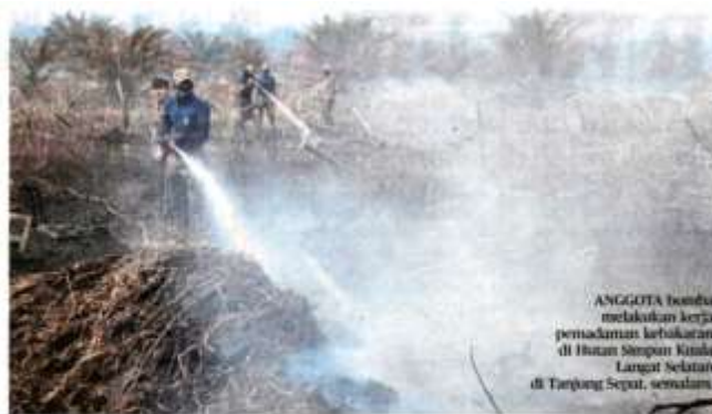
ANGGOTA bomba melakukan kerja pemadaman kebakaran di Hutan Simpan Kuala Langat Selatan di Tanjung Sepat, semalam.