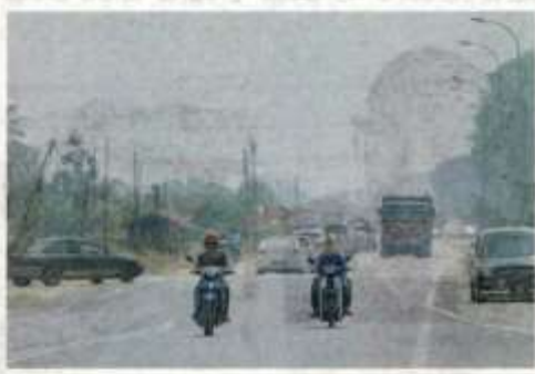
KEADAAN jerebu di sekitar Kampung Johan Setia, Klang dengan bacaan Indeks Pencemaran Udara (IPU) pada 12 tengah hari adalah 189 iaitu paras tidak sihat. – ZULFADHI ZAKI

melibatkan hutan sekunder daripada spesies mahang, serdaiyan, resam, lalang dan tanaman konifer peneroka. Jangkaan operasi pemadaman mengambil masa empat hingga enam minggu," katanya selepas meninjau kawasan kebakaran Hutan Simpan Kekal Kuala Langat Selatan semalam.