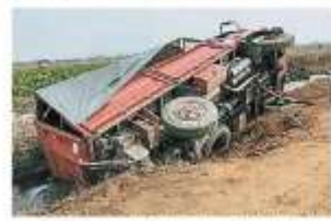
一輛運載滅火設備的羅里，預備待命環境惡劣，加上道路窄小，而不慎進入的集內，所幸未釀任何傷亡事故。