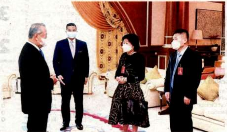
MUHYIDDIN Yassin berbalu dengan Cheung Yan dan Zhang Cheng Fei di Putrajaya, semalam. Turut kelihatan Mohamed Azmin Ail

"Kedua-dua projek ini akan menjana 2,180 peluang pekerjaan dengan hampir 90 peratus adalah rakyat tempatan. Projek di Banting dijadual