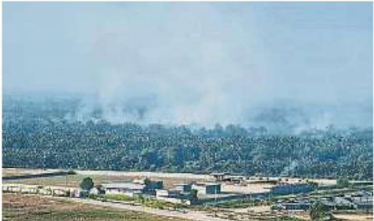
滚滚浓烟升空，使来自林峇尤镇一带的居民感到不适。